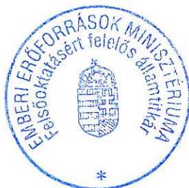
Dr. Palkovics László államtitkár

Az Emberi Erőforrások Minisztériuma Szervezeti és Működési Szabályzatáról szóló 33/2014. (IX. 16.) EMMI utasítás alapján az emberi erőforrások minisztere nevében eljárva: