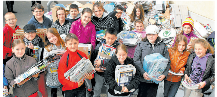
A papírgyűjtések évtizedek óta nagyon sikeresek az iskolánkban

– Az intézkedés miatt jövőre több százezer forinttól eshet el a diákönkormányzat büdzséje. Ebben a tanévben az őszi akció 146, a tavaszi gyűjtés 103 ezer forintot hozott a DÖK „konyhájára”, a pénzt a diákok, osztályközösségek jutalmazására és iskolai programok finanszírozására fordítottuk.