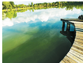
Tájkép kategória, diák: Hován Artúr (3. c)