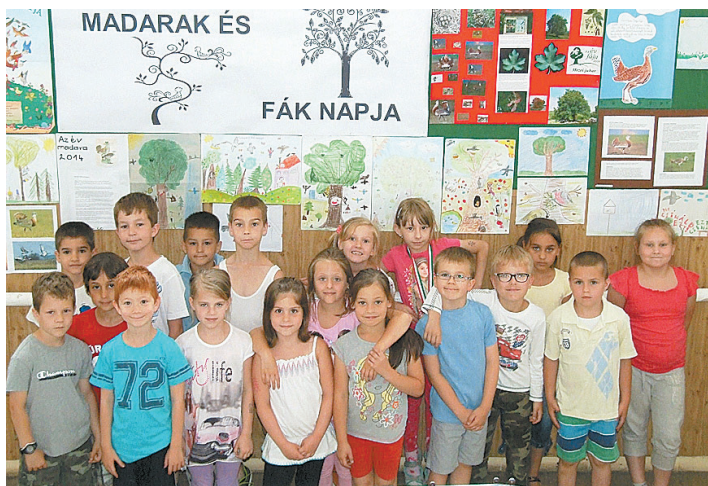
A természetvédelem fontosságára hívtuk fel a figyelmet kiállítással a madarak és fák napja alkalmából