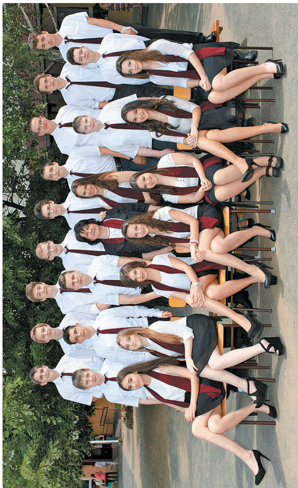
8. c osztály