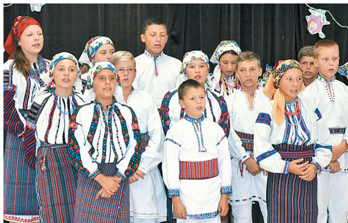
A Csak Tiszta Forrásból csoportból szervezésében moldvai és gyimesi csángó gyerekek vendégeskedtek nálunk tavaly ősszel