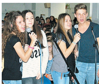
Az Apáczai-hét egyik leghangzatosabb programja: a karaoke