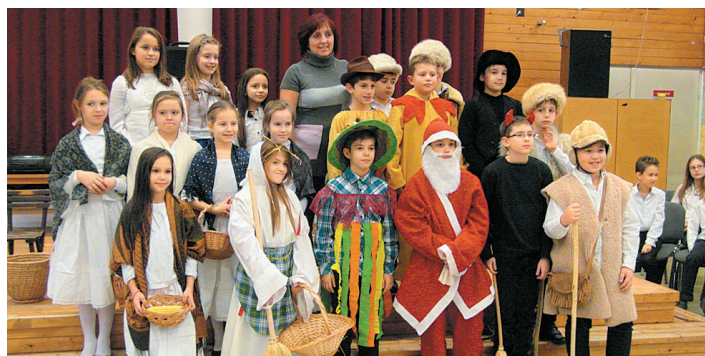
Karácsonyi műsort adtak diákjaink a Cukorbeteges Nyíregyházi Egyesülete székhelyén, a Városmajori Művelődési Házban