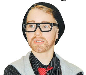
„ByeAlex” is feltűnt a farsangon