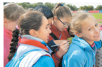
Hát, így is lehet jegyzetelni... – a sportnap egyik vidám pillanata