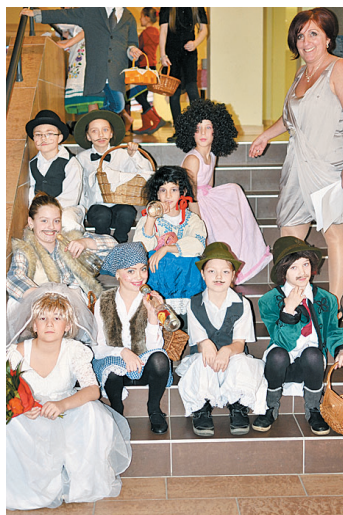
A 17. Apáczai-bálon kitétek magukért a kis művészek