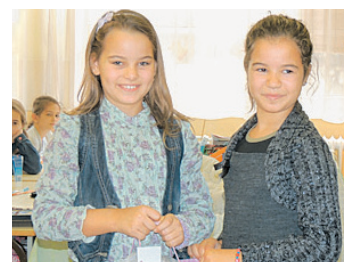
Szeretettel és ajándékokkal fogadtuk a dévai diákokat is