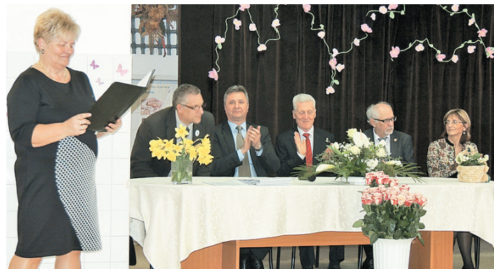
Ebben a tanévben környezetismeret kategóriában adtunk otthont az Országos Apáczaiai Tanítási Versenynek