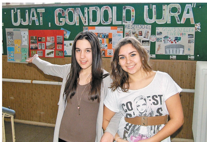
A kukába szánt holmik ötletes újrahasznosítására adtunk tippeket a Régióból újat? Gondold újra! bemutónkon kicsiknek és nagyoknak