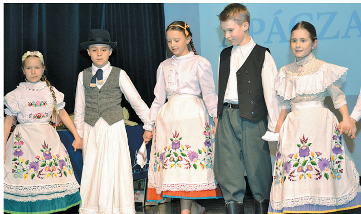
Elkápráztatták a közönséget a növendékek

Az Apáczai Kiadó szervezésében Budapesten rendezték meg a közelmúltban az országos versenytanítás eredményhirdetését és díjátadó ünnepségét. A színvonalas gálaműsorban iskolánk tanulói, a Babszem Táncegyüttes szólistái, valamint a művészeti iskolák dráma- és zenetagozatos növendékei elkápráztatták produkcióikkal a meghívott oktatókat, pedagógusokat és intézményvezetőket.